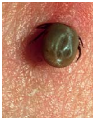
Bild 4 Zecke entfernen: Zecke direkt über der Haut mit Pinzette oder spezieller Zeckenzange fassen und senkrecht zur Hautoberfläche herausziehen. Stichstelle desinfizieren.